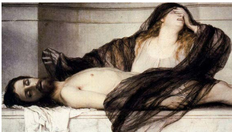
Corpo de Jesus depositado no sepulcro

Não há nenhuma dúvida de que o Hades qual receptáculo das almas dos mortos existe de fato, e que a Bíblia informa que ele fica nas profundezas da Terra. De modo que a citação do “Perspicaz” contém um erro que pode passar despercebido para alguns. Ninguém é sepultado no Hades, mas apenas em uma sepultura. No caso de Jesus, em um sepulcro, acima do nível do solo. O corpo dele nunca esteve nas profundezas do abismo da morte, ou seja, no coração da Terra.